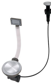
Automatischer Abfluss Space Push - PP 8407 116