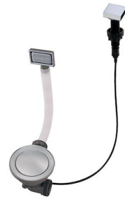
Automatischer Abfluss Space - PA 8407 108