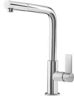
Mischbatterie Omega Plus 8497 020