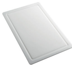
Schneidebrett aus HDPE 8657 001